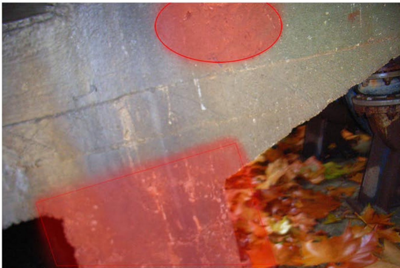
vyspraviť povrchy betónových nosníkov